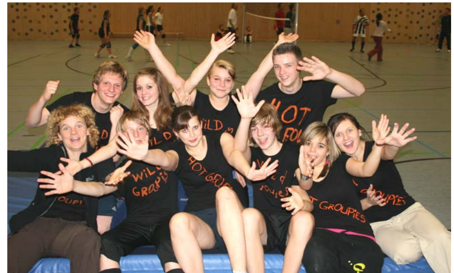
Gruppenhelfer/innen der GH-III-Ausbildung beim Nightevent

Auch in diesem Jahr konnte die Sportjugend Mönchengladbach erfolgreich drei Gruppen- / Sporthelferinnen-I-Ausbildungen, zwei Gruppenhelfer/innen-II-Ausbildungen und eine Gruppenhelfer/innen-III-Ausbildung anbieten.