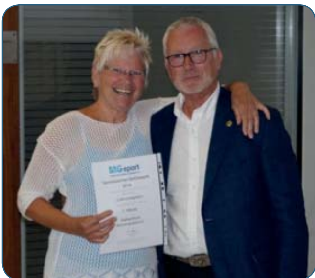
Die Leichtathletikgemeinschaft MG siegte bei den Vereinen (li).

Sprinten wie ein Superstar, ein „Drachen-Ei“ mit Schwung in die richtige Punktzone werfen, ein kleines Maskottchen beim Hindernislauf von Kind zu Kind weitergeben, 30 Sekunden auf einer Hochsprungmatte herumhopsen und während einer Medizinballstaffel gleichzeitig Kraft und Schnelligkeit vereinen, dass waren die Herausforderungen beim zweiten Mönchengladbacher Bewegungspokal am 5. September im Grenzlandstadion.