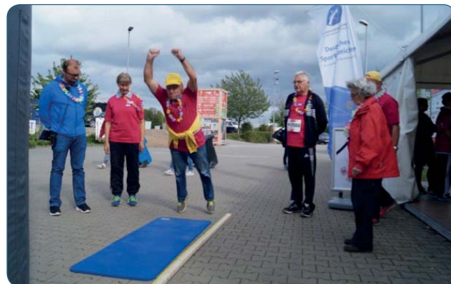
Versuch beim „Standweitsprung“