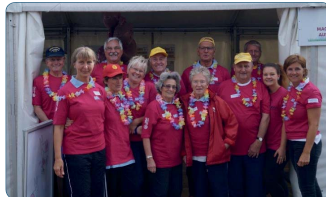
Das Team der „Sportabzeichenprüfer“