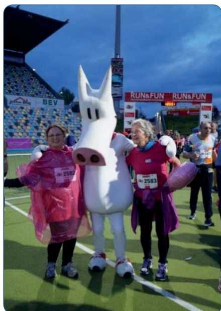
Der „innere Schweinehund“ war auch dabei.

Weitere Informationen gibt es hier: http://www.mg-sport.de/programme/sportabzeichen/spabz-wettbewerb/