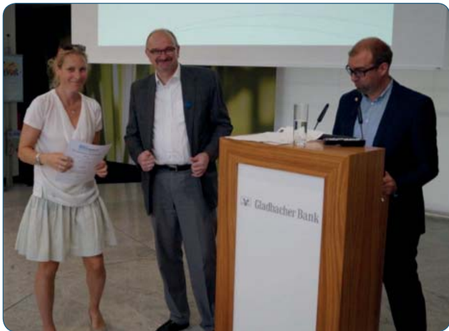
1. Platz der Grundschulen: KGS Annaschule (li).