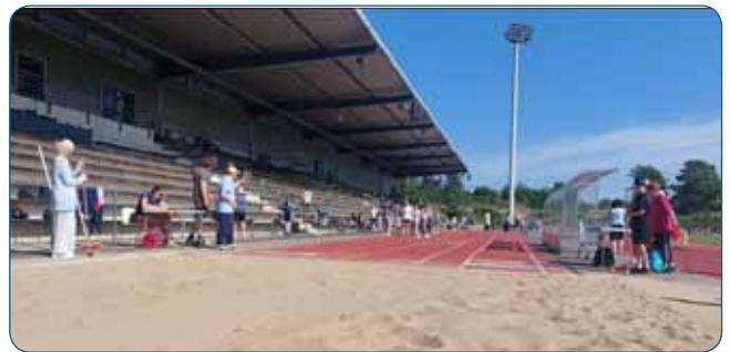
Sportabzeigentage der Schulen im Grenzlandstadion

Schulen, Vereine und Familien sind auch dieses Jahr wieder aufgerufen, sich an dem Sportabzeichen-Wettbewerb von Landessportbund und Stadtsportbund zu beteiligen. Alle beim SSB eingereichten Prüfkarten zählen bei der Wertung mit. Es gibt attraktive Preise zu gewinnen.