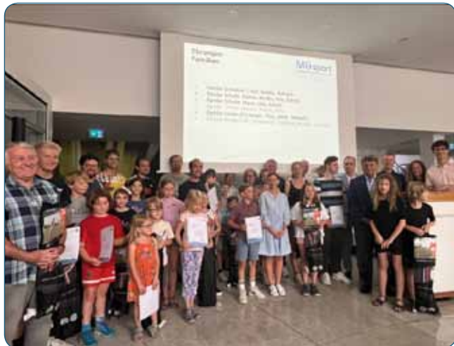
Ehrung der Familiensportabzeichen

https://www.mg-sport.de/unsere-themen/sportabzeichen