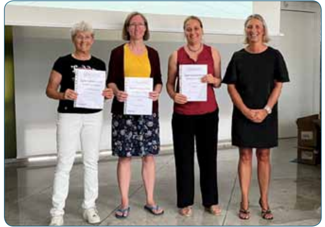
Ehrung der Schulsieger

Nach zwei Jahren Coronapause, ehrte der SSB die erfolgreichsten Teilnehmerinnen und Teilnehmer, Familien sowie die Sieger des Sportabzeichenwettbewerbes 2022 der Schulen und Vereine mit einem kleinen Empfang am 17. Juni in der Hauptstelle der Gladbacher Bank.